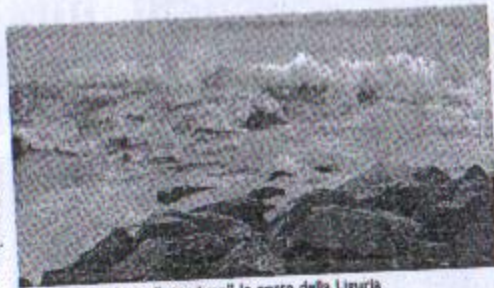
Le mareggiate "mangiano" le coste della Liguria

tivi e organizzativi per la gestione della difesa delle coste da parte di tutti i soggetti coinvolti. Il progetto coinvolge nove regioni di quattro Paesi del Mediterraneo (Grecia, Francia, Spagna, Italia) con cui collaborano 11 osservatori tra cui Enti e società del Marocco e della Tunisia. I partner regionali sono costituiti da 96 enti pubblici e privati quali istituti universitari, centri e laboratori di ricerca, agenzie per la protezione ambientale, amministrazioni locali. La Regione dal 2005 ad oggi ha speso per la salvaguardia delle spiagge liguri 20 milioni di euro così suddivisi: 9 alla provincia di Imperia, 4 a Genova e Spezia e 3 a Savona.