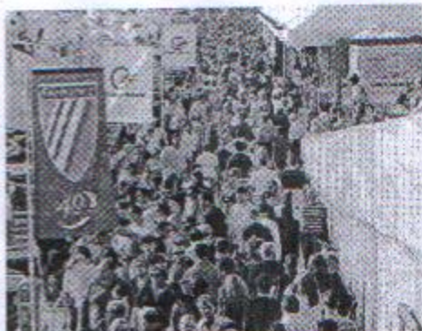
L'assalto dei visitatori ieri tra i padiglioni del Salone Nautico

«Genova ha capito quale grande opportunità offre il Salone Nautico. La città e la Liguria devono rendersi conto che ogni anno ospitano l'evento più importante di un settore non più marginale, un settore che fa dell'Italia il leader della produzione nautica mondiale. Proviamo a vederla da un punto di vista diverso rispetto al business degli operatori e alle svaghe dei visitatori. Il Salone è diventato l'evento centrale delle offerte di Genova e della Liguria. Si comincia a valutare l'impatto sulla città dell'indotto (70 milioni di euro, ndr) nei nove giorni del Salone. La ricettività alberghiera è certamente migliorata e il ricorso alle risorse della due riviere dovrà crescere ancora. L'ut-